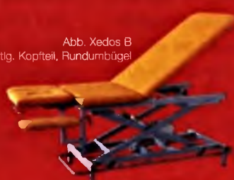
Abb. Xedos B mit 3-tlg. Kopfteil, Rundumbügel