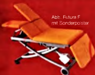
Abb. Futura F mit Sonderpoister