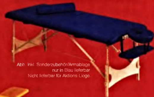
Abb. inkl. Sonderzubehör/Armbalage nur in Blau lieferbar Nicht lieferbar für Aktionspreis.